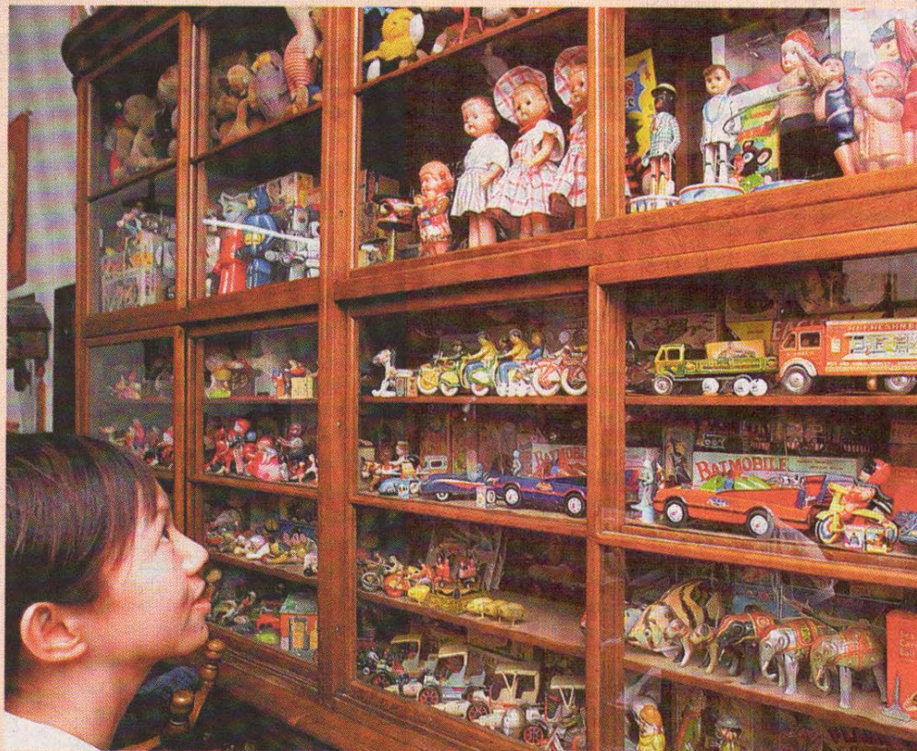
玩具博物馆的发起人是一名50多岁的古董玩具收藏家，他收藏古董玩具至少有25年的时间，玩具数量至少有一万个。

占大多数，有上发条的，也有以电池操作的。其他种类的玩具包括塑料玩具、赛璐洛 (celluloid) 玩具、铅制玩具、毛绒玩具、木制玩具、游戏和漫画等。